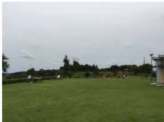
△ヒント 公園です。奥に複合遊具があります。