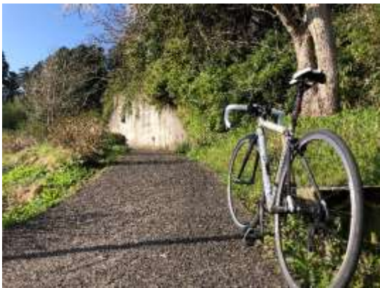
△ヒント 曲がりくねった坂道です