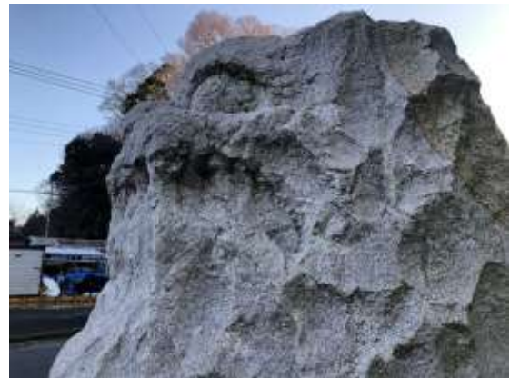
△ヒント 石像は2体。一体は吉田石油大工町店 もう一対の石像を探してください。