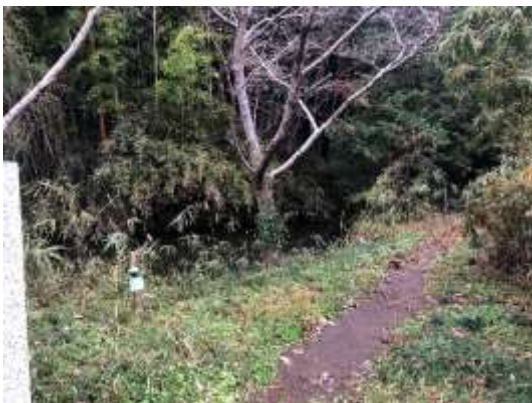
△ヒント 奥に見えるのは桜川です。